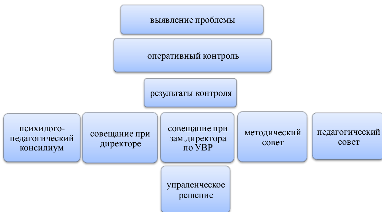
Схема оперативного контроля за выполнением основных разделов Программы развития